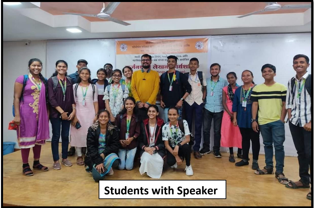
Students with Speaker