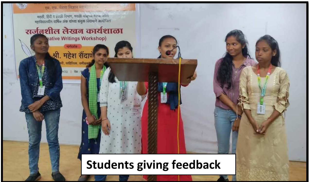
Students giving feedback