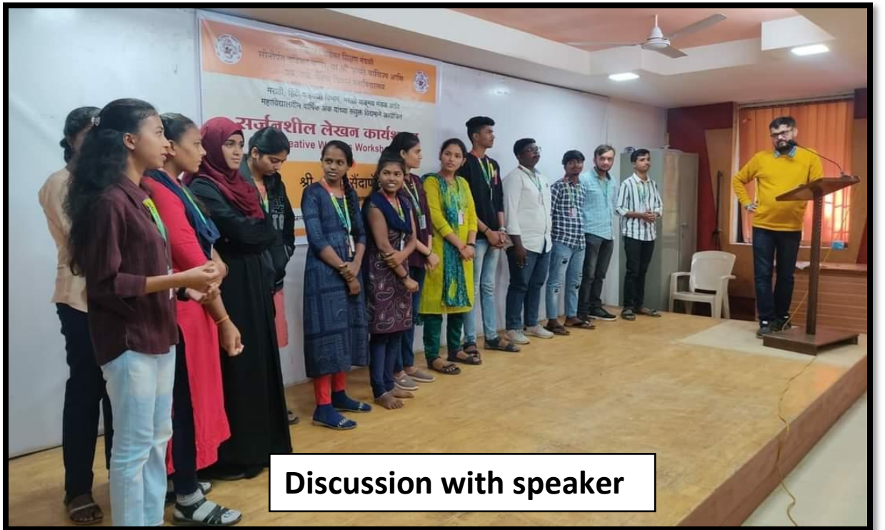
Discussion with speaker